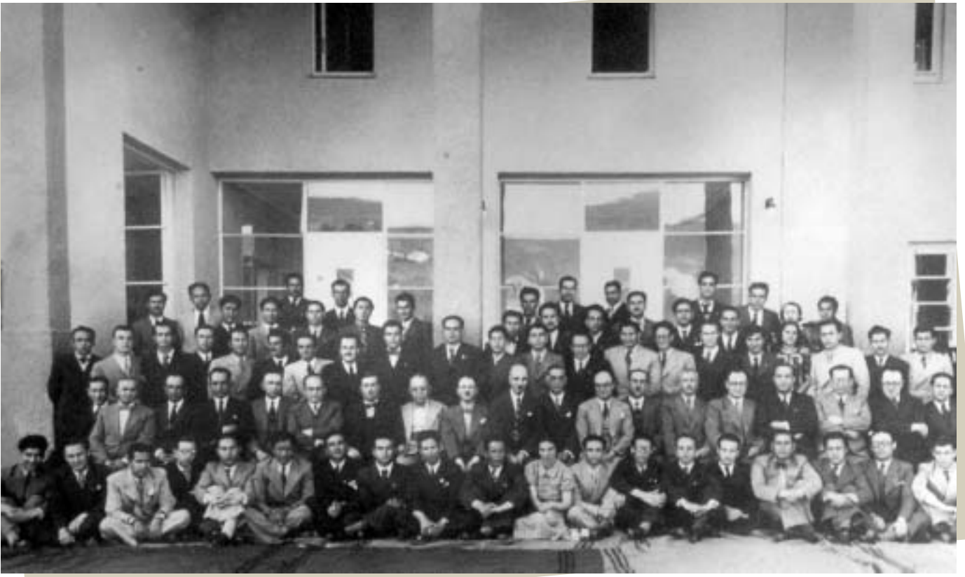
6 Kasım 1936'da İstanbul'dan Ankara'ya taşınan Siyasal Bilgiler Okulu'nun, Ankara'daki ilk mezunları • 1937